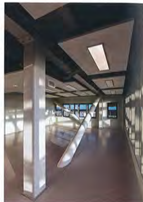
In verband met betonkernactivering zijn open plafonds toegepast.

hoek van het atrium, waar enkele facilitaire ruimten zijn: "Kantoorruimte past hier niet vanwege BREEAM-NL. We wilden namelijk voor het certificaat voldoen aan het aspect dat er minimaal tien meter ruimte zit tussen de kantoren in verband met daglicht en uitzicht."