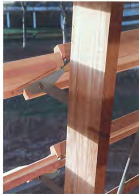
De consoles zijn in drie richtingen te stellen: om de as, door de verstelbare hoekprofielen en op de halfronde lat op de profielen.

De lamellen zijn aan de lange zijden versterkt met een rib, die er tevens voor zorgt dat er meer zonlicht wordt geweerd. Voor de afgeronde gebouwhoeken zijn speciale hoekstukken gemaakt. Deze zijn opgebouwd uit enkele segmenten, die onderling een maximale hoek van vijf graden maken. Door de lamellen in een 3D-model uit te werken konden ze CNC worden gezaagd. Het western red cedar van de lamellen is niet behandeld en zal gaan vergrijzen. Door de vorm is het waarschijnlijk dat ook afgengroei en schimmelvorming ontstaan. Overwogen is om de lamellen daarom met een nanocoating te behandelen, zodat het water er afdruppelt. Deze behandeling moet na twintig jaar herhaald worden. Vanwege terugkerend onderhoud zag de gemeente daarvan af, vertelt Van Wieren.