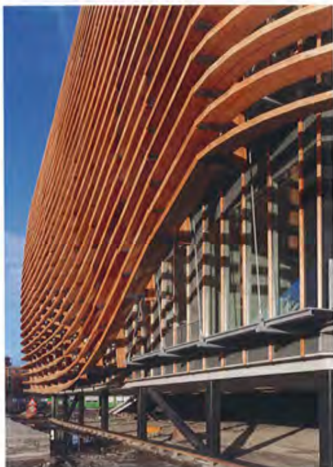
Nabij de hoofdentree worden de golven met lamellen als het ware omhoog geduwd.

ting. Die verloren bekisting zorgt ervoor dat er geen contact ontstaat tussen de grond en de vloerplaat. Na het verharden van het beton is de bekisting gevuld met water voor het oplossen van het karton.