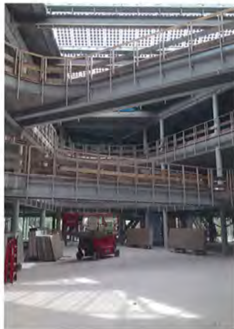
Staalstructuur van de bruggen in het atrium.

"De afgeronde vormen van het atrium zijn veel beter te volgen met een stalen kolommenstructuur"