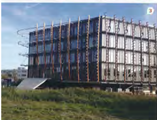
1 // De staalconstructie in de afgesneden hoek aan de zuidkant van het gebouw is aan het buitenklimaat blootgesteld. 2 // Montage van de staalconstructie voor de lamellengevel. 3 // De houten spantbenen met de consoles voor de lamellengevel zijn op stalen dragers gemonteerd.

Leeuwarden heeft de ambitie om uit te groeien tot dé Europese hoofdstad op het gebied van watertechnologie. Dat gebeurt op de WaterCampus, waar wetenschappers en ondernemers werken aan kennisbundeling en innovatie. In het nieuwste bedrijfsverzamelgebouw op de campus zijn laboratoria voor chemisch en microbiologisch onderzoek gevestigd en kantoorruimtes voor Wetsus en startende ondernemers op het gebied van energie- en watertechnologie. In dit kader ontving Leeuwarden als tweede stad ter wereld de titel Innovating City van de Verenigde Naties.