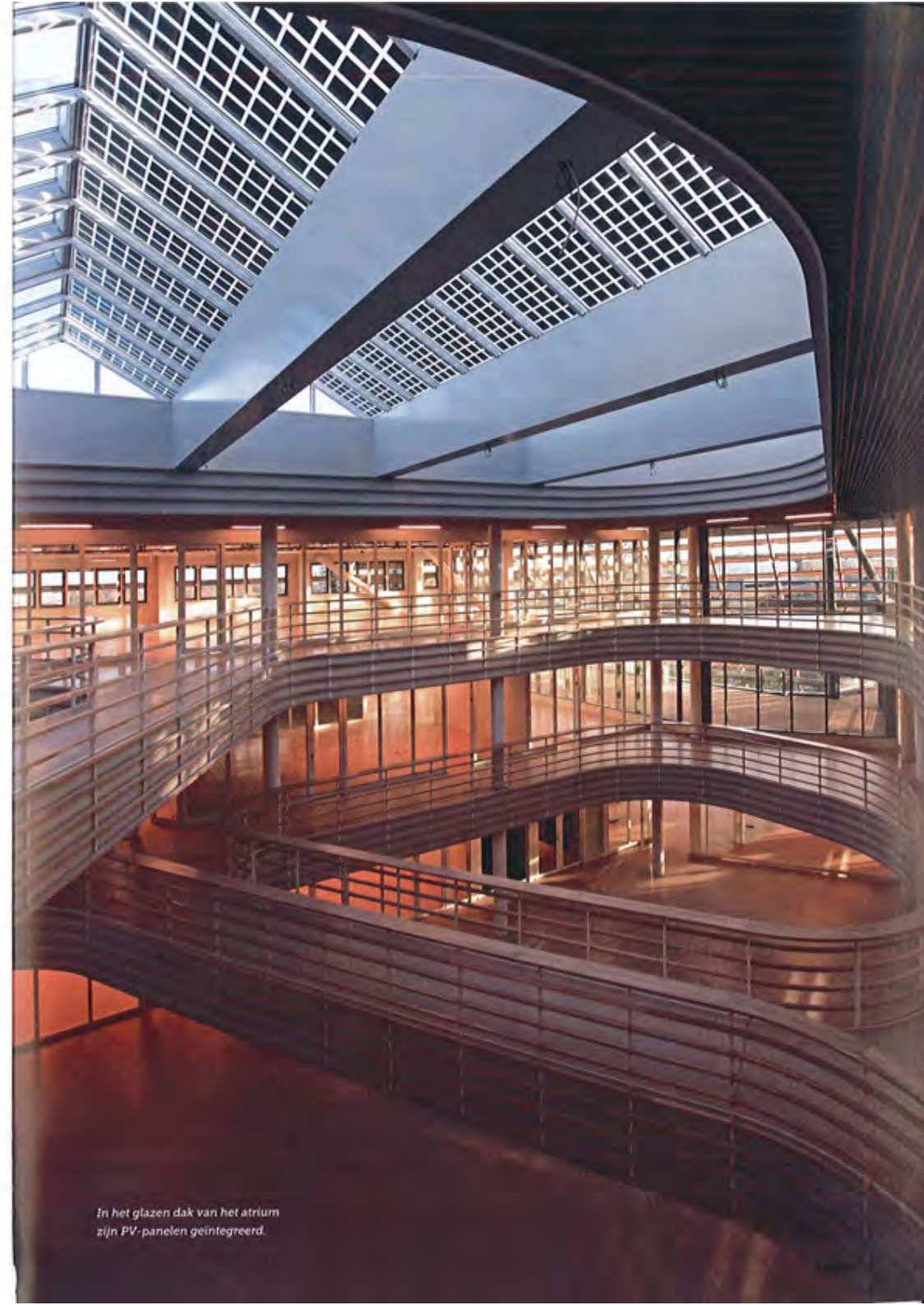
In het glazen dak van het atrium zijn PV-panelen geïntegreerd.

Projectgegevens // Locatie: Oostergoweg, Leeuwarden // Opdrachtgever: Gemeente Leeuwarden // Architect: GEAR, Leeuwarden, gear.nu // Adviseur constructies: Wassenaar Ingenieurs, Haren, wassenaarbv.nl // Adviseur installaties, energie, duurzaamheid en bouw fysica: Advies- en ingenieursbureau Grontmij, De Bilt, grontmij.nl // Uitvoering en engineering: BAM Utiliteitsbouw Noord, Groningen, bam.nl // Bruto vloeroppervlakte: 7500 m 2 // Bouwkosten: 1575,- euro per m 2 BVO, incl. installaties, excl. btw // Bouwperiode: december 2013 – december 2014.