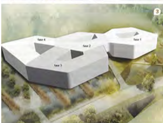
1 // Kantoorruimte met eilandplafonds. Naast het creëren van een goede lichtverspreiding zijn de eilandplafonds ook belangrijk voor de akoestiek. 2 // In het restaurant zijn ronde eilandplafonds toegepast. 3 // Het gebouw is de eerste van een reeks uitbreidingen, die zich als celdelingen aansluiten. De gevel is demontabel uitgevoerd, zodat de volgende cel op eenvoudige wijze kan aansluiten. (Afbeelding: GEAR)

zijn en moet ook op langere termijn kunnen functioneren. Het indelingsstramien voor de kantoorruimten is per 1,8 en soms per 0,9 meter aanpasbaar, in elk geval wat de aansluiting op de gevels betreft. Het gevelstramien verspringt 0,45 meter ten opzichte van het constructieve stramien van de kolommen (die om de 5,4 meter staan), zodat binnenwanden niet op kolommen hoeven aan te sluiten.