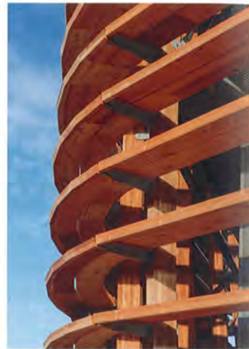
Voor de afgeronde gebouwhoeken zijn speciale, gesegmenteerde hoekstukken gemaakt.

De eigenlijke thermische schil bestaat uit houtskeletbouw met houten kozijnen, die aan de buitenzijde zijn afgedekt met een aluminium deklust. Deze gevel heeft een R_v -waarde van 5 \text{ m}^2 \text{ K/W} . Voor het behalen van de vereiste duurzaamheidsprestaties is de schil goed geïsoleerd met onder andere triple glas en wordt de benodigde energie op duurzame wijze opgewekt, vertelt duurzaamheidsadviseur en BREEAM-expert Leon Burdorf van advies- en ingenieursbureau Grontmij. Zo ligt er vanuit het ontwerp het uitgangspunt voor zo'n 1000 \text{ m}^2 aan PV-panelen. Interessant is ook de toepassing van biogas voor stoken van de verwarmingsketel. Burdorf: "We hebben in de beginfase overwogen om een WKO-installatie aan te leggen, maar de toepassing van biogas van het rioolwaterzuiveringsbedrijf Wetterskip bleek een aantrekkelijkere optie voor duurzame energie." Voor de koeling is eveneens een duurzame installatie toegepast. Deze werkt volgens een adiabatisch principe: in de installatie wordt water verneveld, waardoor de luchttemperatuur afneemt (verdampingskoeling). Via een warmtewisselaar wordt de op-